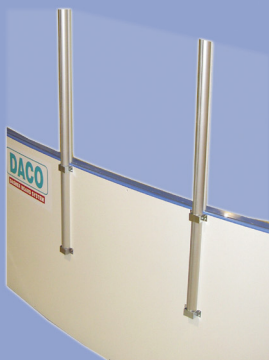
FS1 med isolering och baksidesbeklädnad

Isolering+baksidesbeklädnad ger lägre ljudnivå samt energibesparing Isdamm